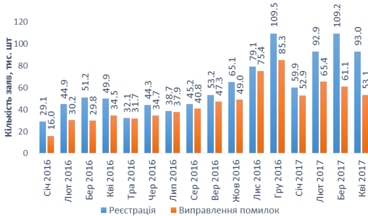
Рисунок 1. Динаміка реєстрації земельних ділянок і виправлення помилок, 2016 - січень-квітень 2017